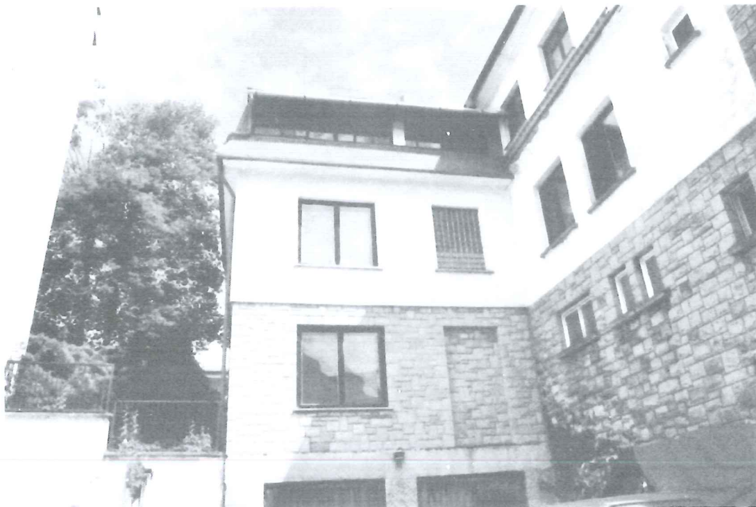
Fot 3. Ściana zachodnia Domu Katechetycznego, przylegająca do Plebanii. (stan na dzień 1.08.2019).