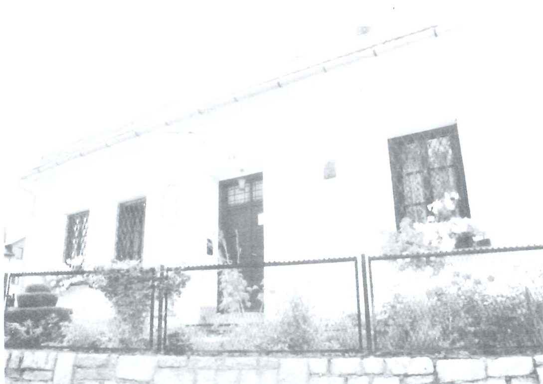
Fot 8. Budynek Caritas, widok od strony wschodniej. (stan na dzień 1.08.2019).