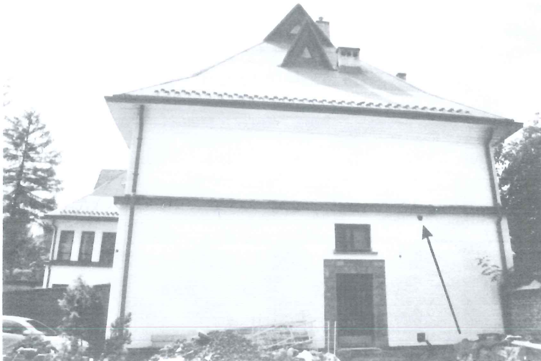
Fot 5. Ściana wschodnia Domu Pielgrzyma. Zaznaczono niezakratowane okienko wentylacyjne - potencjalne siedlisko ptaków. (stan na dzień 1.08.2019).