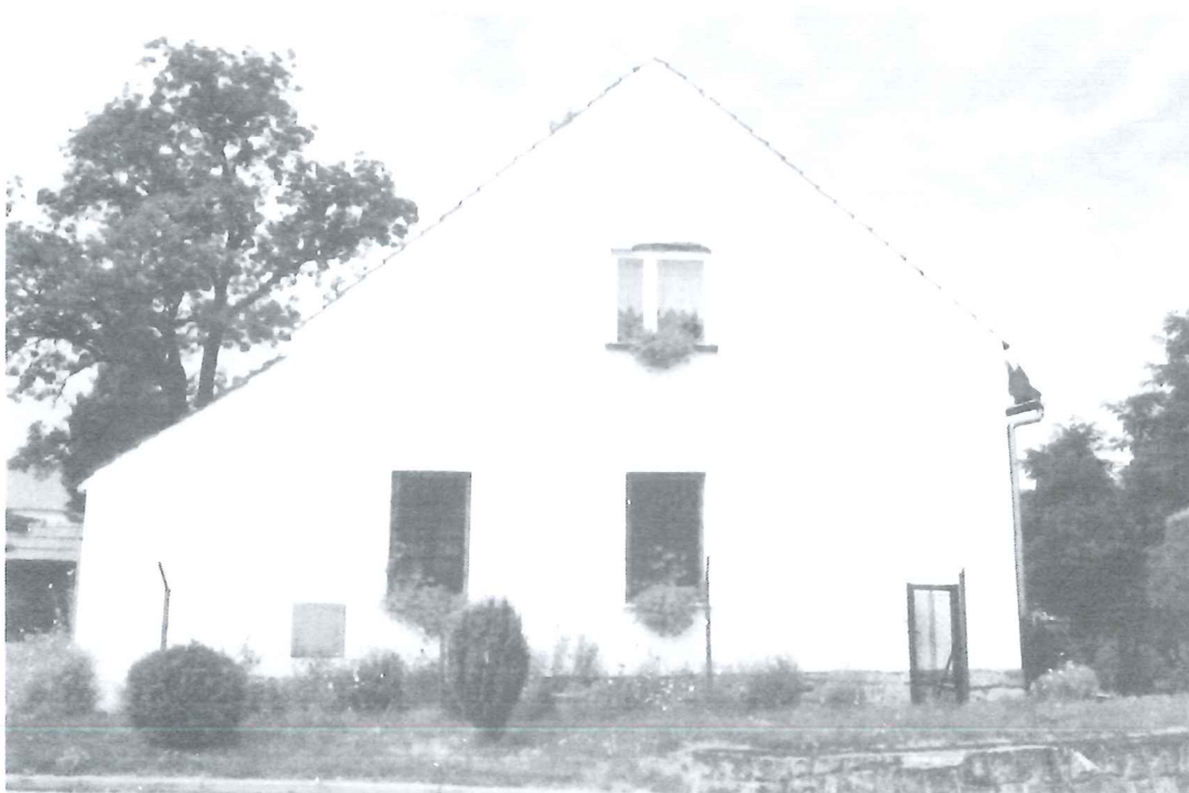
Fot 11. Budynek Caritas - widok od strony południowej. (stan na dzień 1.08.2019).