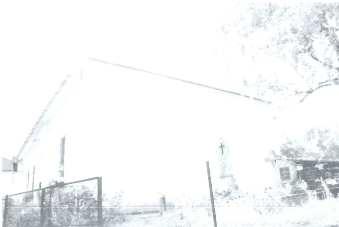
Fot 9. Ściana północna budynku Caritas. (stan na dzień 1.08.2019).