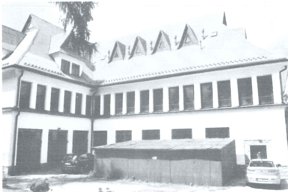
Fot 4. Dom Pielgrzyma, widok od strony południowej (stan na dzień 1.08.2019).