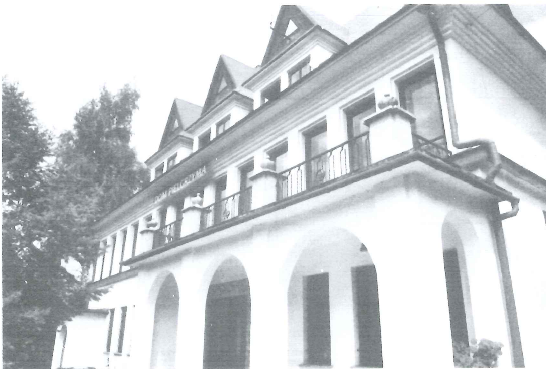
Fot 6. Ściana zachodnia Domu Pielgrzyma. (stan na dzień 1.08.2019).