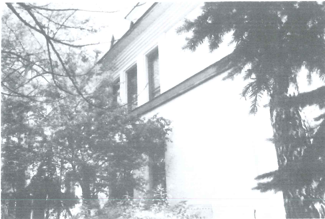
Fot 7. Ściana północna Domu Pielgrzyma. (stan na dzień 1.08.2019).