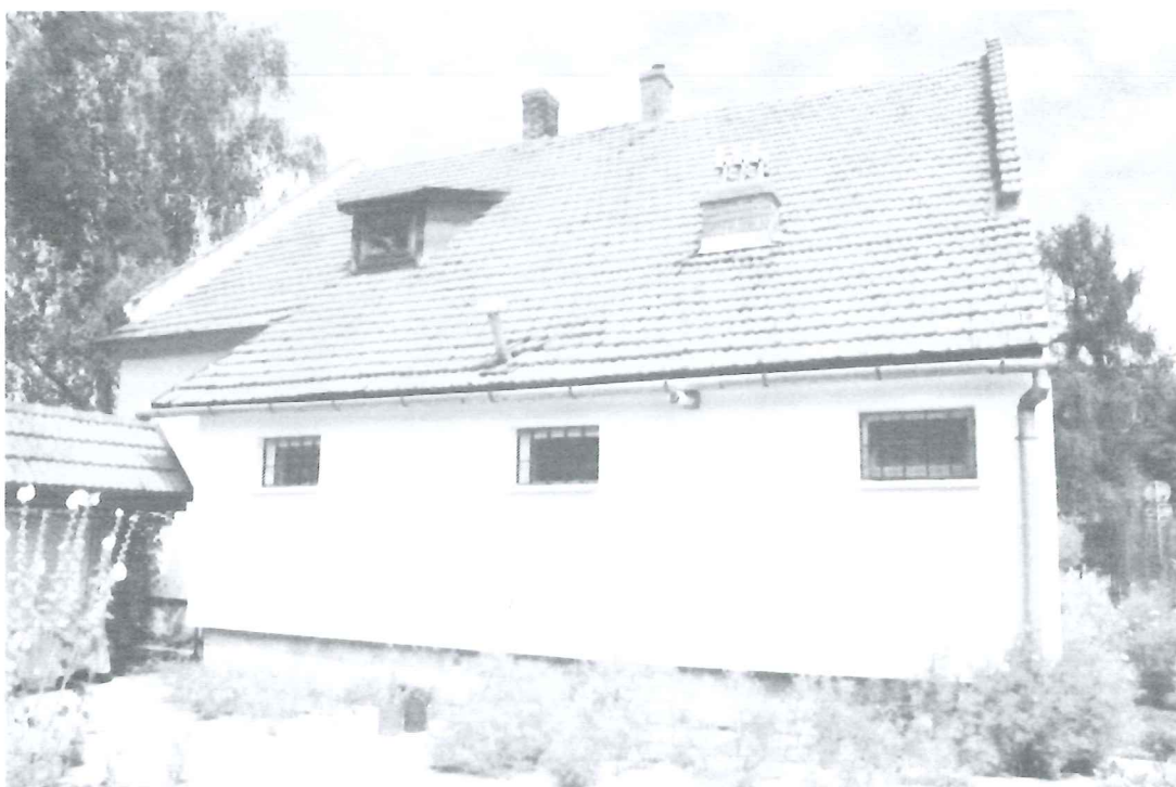
Fot 10. Ściana zachodnia budynku Caritas. (stan na dzień 1.08.2019).