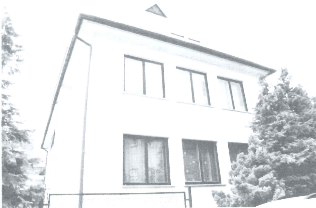
Fot 2. Dom Katechetyczny, ściana wschodnia. (stan na dzień 1.08.2019)